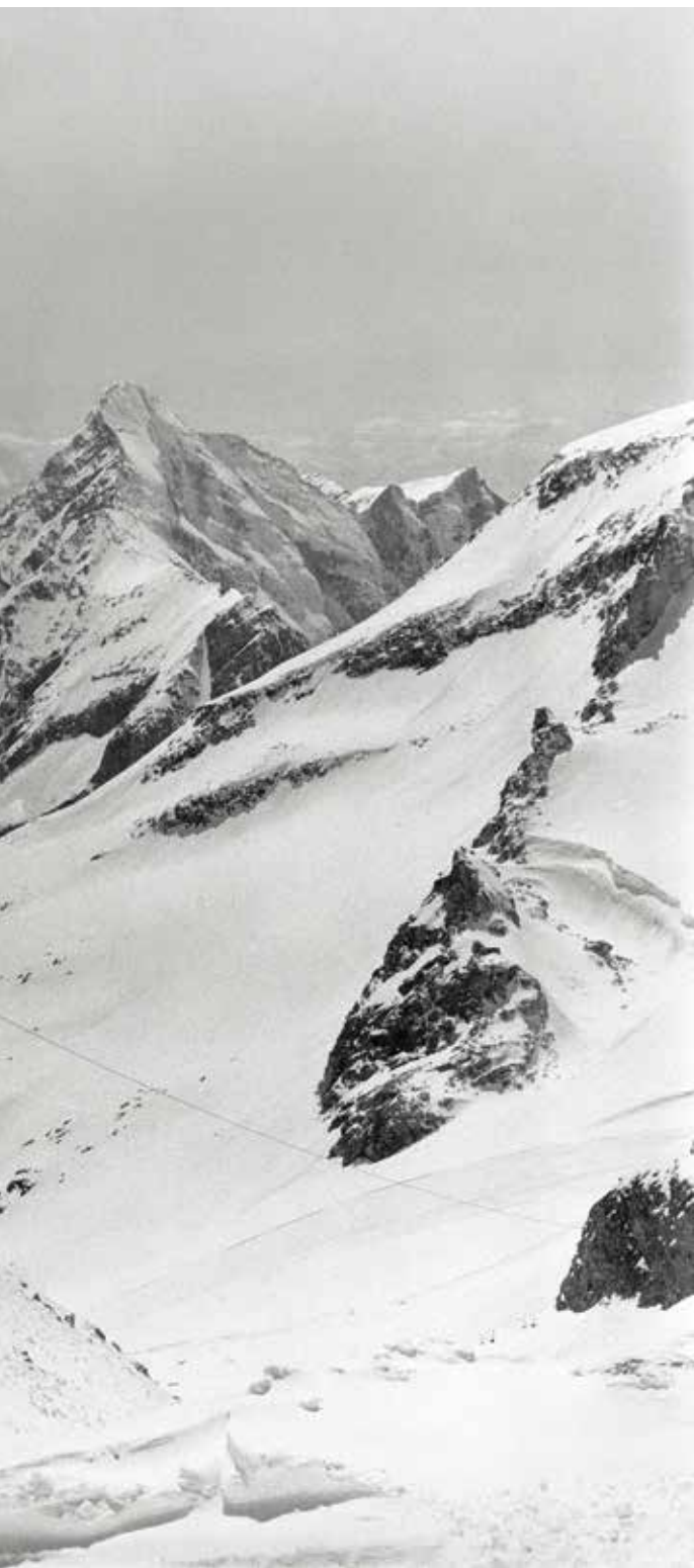
The Living Mountain - #570-18, 2020, silver gelatine print