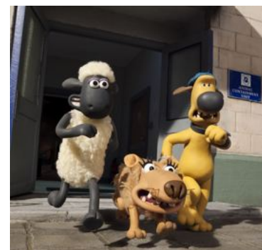
'Shaun the sheep': downloadtopper.

Terwijl in de Benelux piraterij geïllustreerd wordt, deelt Duitsland